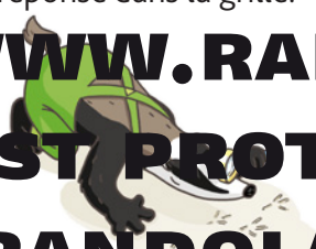
Grille réponse Circuit n° 16 (2021)

À quelle époque est-elle faite moudre le grain ? Note ta réponse dans la grille.