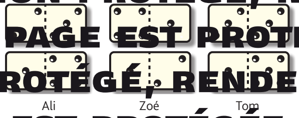
Ali Zoé Tom

Trouve le panneau « A la croisée des chemins, des terres convoitées. » dans la grille de bas de page les réponses trouvées en faisant les ombres correspondantes.