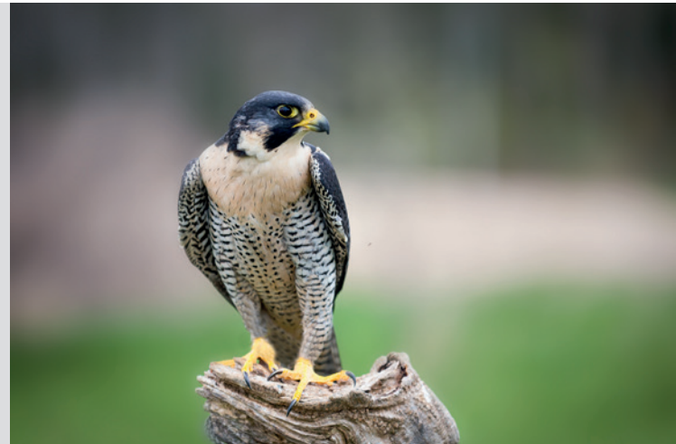
Le faucon pèlerin

Grâce aux indices de l'Inspecteur Rando, sauras-tu trouver de qui il s'agit ?