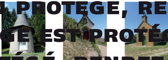
YVES MARGOT SIMON

Parmi les trois photos ci-dessous, laquelle montre la chapelle devant toi ?